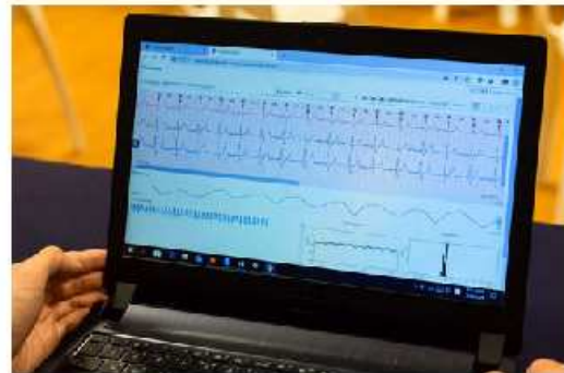
圖說：手環檢測的數據經藍芽傳到手機(左)後，再上傳至雲端，用電腦(右)呈現的樣態。