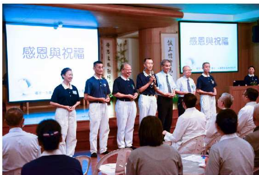
圖說：合心志工團隊感恩醫療團隊對環保志工的照顧。

本次活動，心律不整篩檢的 88 人次中，有 22 人出現心律不整情形，其中 4 個人是心房顫動；而失智篩檢人數共 90 人，2 人已收案，19 人將轉介記憶門診評估追蹤。張恒嘉副院長發下大愛感恩科技用回收寶特瓶做