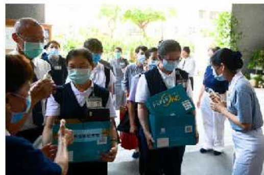
圖說：醫療團隊來到雙和靜思堂，志工們熱情迎接。