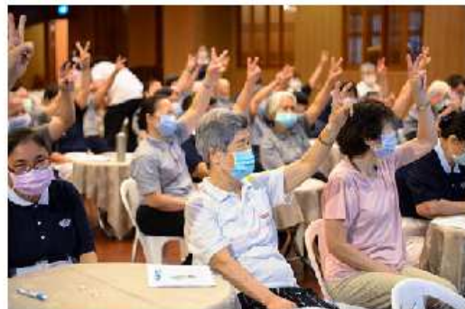
圖說：環保菩薩們貼上貼紙，在主持人引導下，開始一下午的健康衛教活動。

過往監測心電圖必須到醫院，在胸口貼上貼片，躺上檢查床數分鐘才能獲得資料；但羅孟宗教授為首的團隊因應人口高齡化，研發出能簡易篩檢心律不整的智慧手錶，並已取得美國與台灣的「FDA 醫療認證」，這次健康衛教活動，研發團隊特地前來協助環保菩薩使用。「這個系統是微縮型的心電圖裝置，只要按住上下兩個導極，就能形成迴路，測量心電圖。」曾是第一代慈青的羅教授分享，目前這組系統在台灣已經檢測 14000 人次，他非常高興有機會回到慈濟付出，希望貢獻力量，守護環保菩薩的健康。