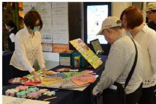
圖說：「健康促進」由社區醫學部給予衛教手冊，教導民眾保健知識（左）；癌症中心設計轉盤遊戲教育民眾檳榔防治觀念（右）。