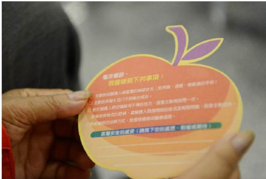
圖說：發放給民眾蘋果響應卡，一同提倡醫病溝通，讓就醫更安全。