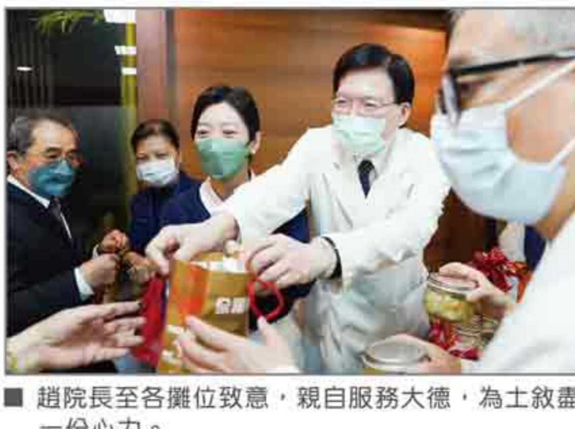
趙院長至各攤位致意，親自服務大德，為土敘盡一份心力。