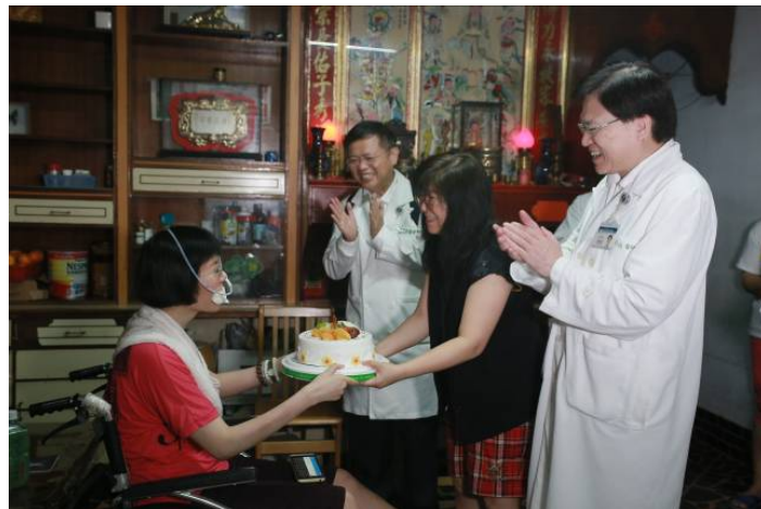
圖說：小惠送蛋糕給媽媽當作母親節的祝福。

2018年4月22日母親節前夕，藉著人醫會義診，趙院長及徐副院長一行人至小惠家關懷，並準備蛋糕讓小惠送給媽媽當作母親節的祝福；經過一段時間練習，小惠已能藉由助行器的幫助行走，完成自行到洗手間、上下樓梯的心願。身高172公分的小惠，上下樓梯都需要爸爸背，爸爸曾表示，「我真的快揹不動她了！」如今小惠能行走，是回饋爸媽最好的禮物。