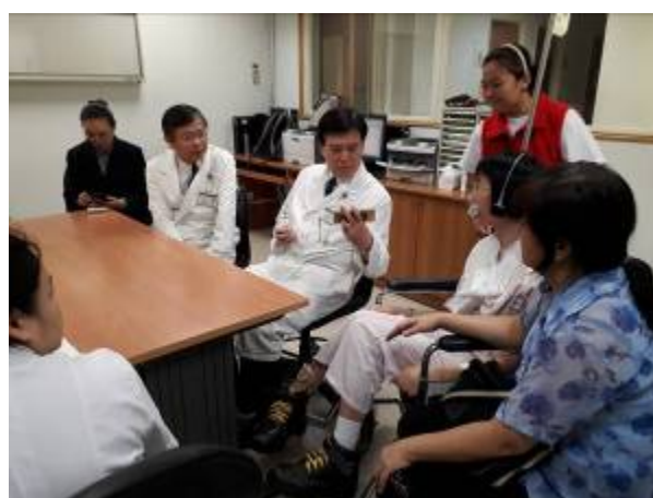
圖說：小惠術前的家庭會議。