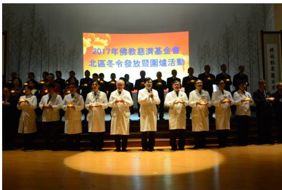
圖說：點燃心燈，祈願願願都圓滿。