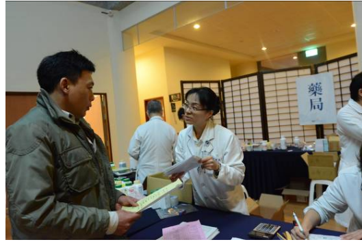
圖說：醫護團隊用心關懷照顧戶，仔細診查、提供醫療諮詢。