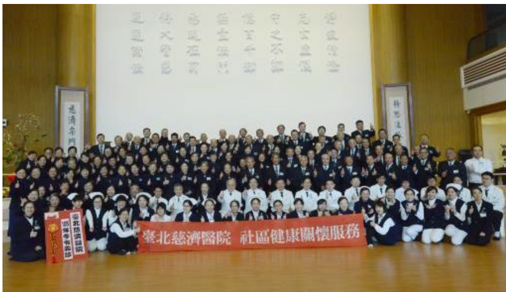
圖說：50位台北慈院同仁，到慈濟新店靜思堂，為照顧戶義診、發放物資，並參與歲末圍爐。

1月15日，新店靜思堂舉辦「冬令發放暨圍爐」活動，新北市侯友宜副市長、社會局官員、各區議員及鄰里長約20位共襄盛舉，前來送祝福。台北慈濟醫院在趙有誠院長帶領下，醫護、醫技及行政共50位參與活動，為249個照顧戶義診、發放物資，並陪伴歲末圍爐。