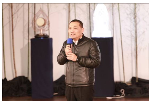
圖說：新北市侯友宜副市長蒞臨現場，送祝福道感恩。