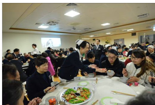
圖說：醫護團隊換了上菜裝，恭敬端上一盤盤美味佳餚，並與照顧戶一起圍爐。