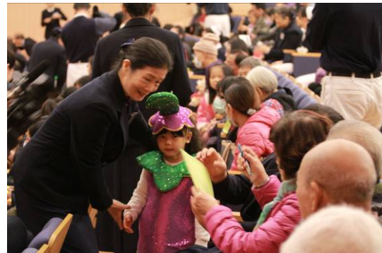
圖說：平日在學校都吃素食的仁美幼兒園孩子們，手拿著勸素卡，下台邀請大家一起茹素。