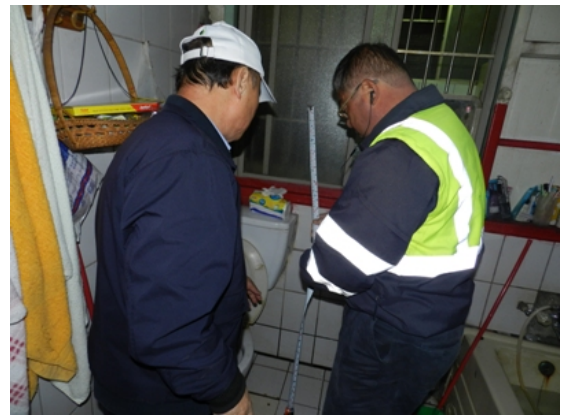
圖說：北區營建處同仁與志工協丈量樓梯與浴室洗臉台尺寸。