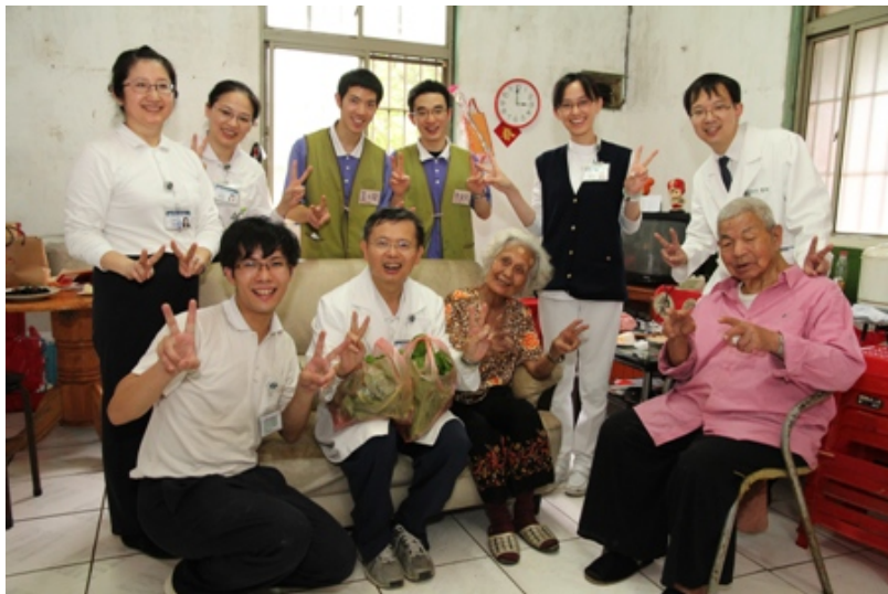
圖說：臺北慈院同仁與兩位長者共度歡樂的午後時光。

回到屋內，擺上「母親節快樂」的蛋糕，讓高金阿嬤有點驚訝。大家唱起「母親的手」歌曲，阿嬤不禁流下眼淚，「你們來我好高興，謝謝你們，我很感動，心一直蹦蹦跳；你們幫忙這麼多，感謝感謝……」阿公也：「有你們來服務，我實在無以回報，真的不好意思，謝謝大家。」